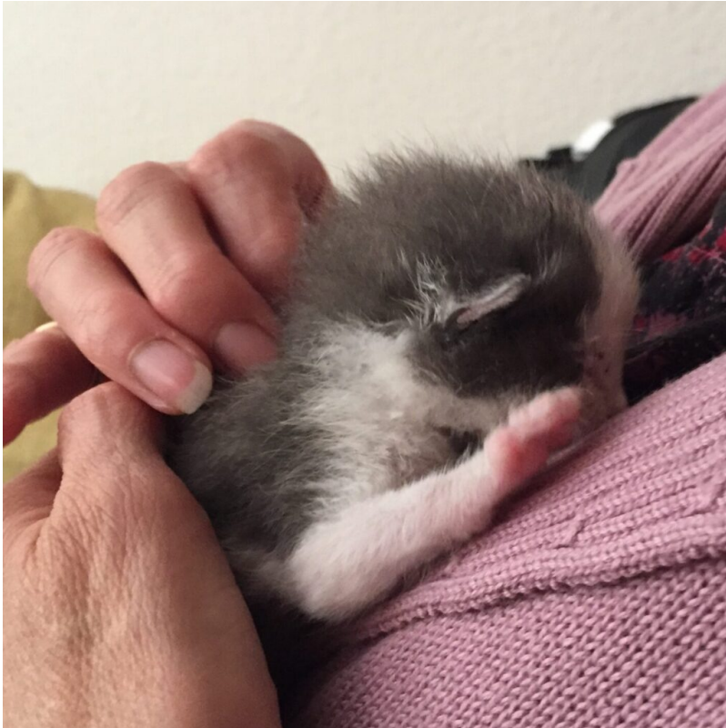
Nejro wog nur gerade 141g.